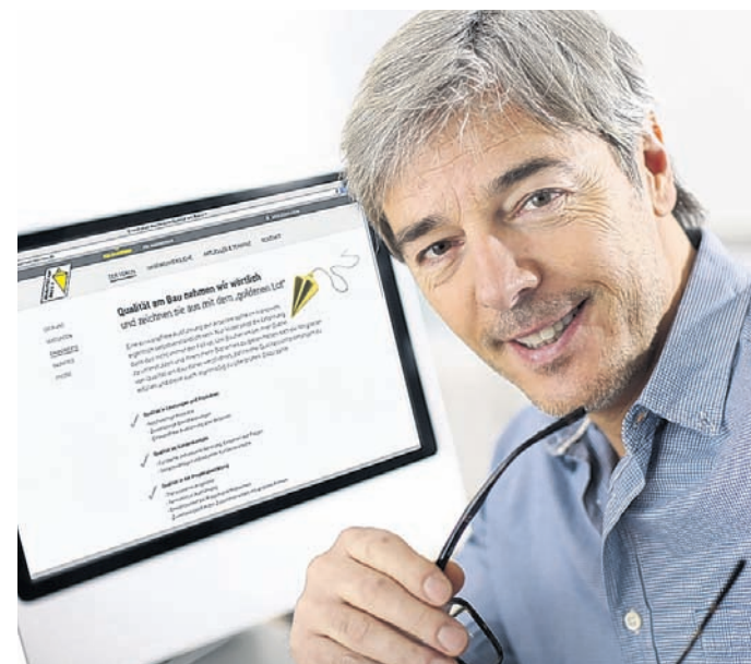
Wer das Gütesiegel des „Goldenen Lots“ trägt, wurde vom Verein „Qualität am Bau“ genauestens unter die Lupe genommen.

Wer sich digital informiert hat, sollte die Chance nutzen, auf der Messe „Bau im Lot“ den persönlichen Kontakt mit den Herstellern zu suchen. Hier erhält der Besucher Infos aus erster Hand und kann sich von den vielen Ausstellern beraten lassen. Eine Liste der teilnehmenden Firmen sowie die Übersicht der Fachvorträge finden Interessierte unter www.messe-im-lot.de auf den – ebenfalls neu gestalteten – Internetseiten der Baumesse. pm/va